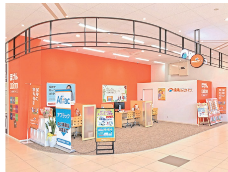
※画像は既存店舗の写真です

名鉄三河線・豊田線「梅坪」駅から徒歩約13分、「豊田市」駅から徒歩約17分、クロスモール豊田陣中1階