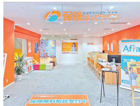
※画像は既存店舗の写真です