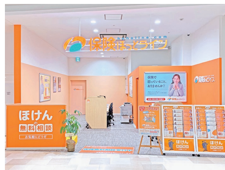
※画像は既存店舗の写真です

JR 神戸線「明石」駅・山陽電鉄本線「山陽明石」駅南口から徒歩約3分、アスピア明石 地下1階