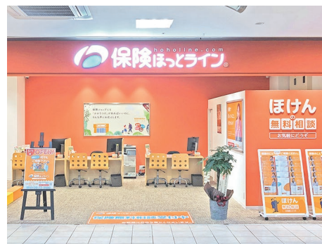
※画像は既存店舗の写真です

JR 東海道本線「安城」駅から徒歩約10分、名鉄西尾線「北安城」駅から徒歩約14分、ららぽーと安城 3階